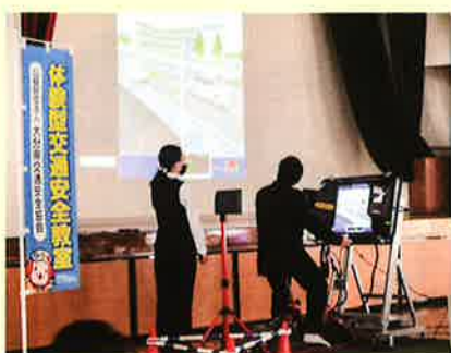
自転車シミュレーターを活用した交通安全教育 (県内の高等学校にて)

(公財)大分県交通安全協会は、警察の業務委託を受け、県内の学校や事業所等において、子供や高齢者等を対象に体験型交通安全教育機器を活用した交通安全教育を実施して、交通事故の未然防止活動を行っています。