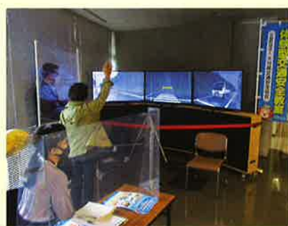
歩行シミュレーターを活用した交通安全教育 (運転免許センターにて)