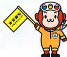
(公財)大分県交通安全協会 公式キャラクター「さるーる」