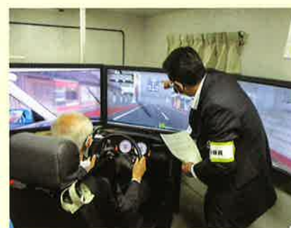
ドライビングシミュレーターを活用した交通安全教育 交通安全教育車「セーフティーぶんご」にて