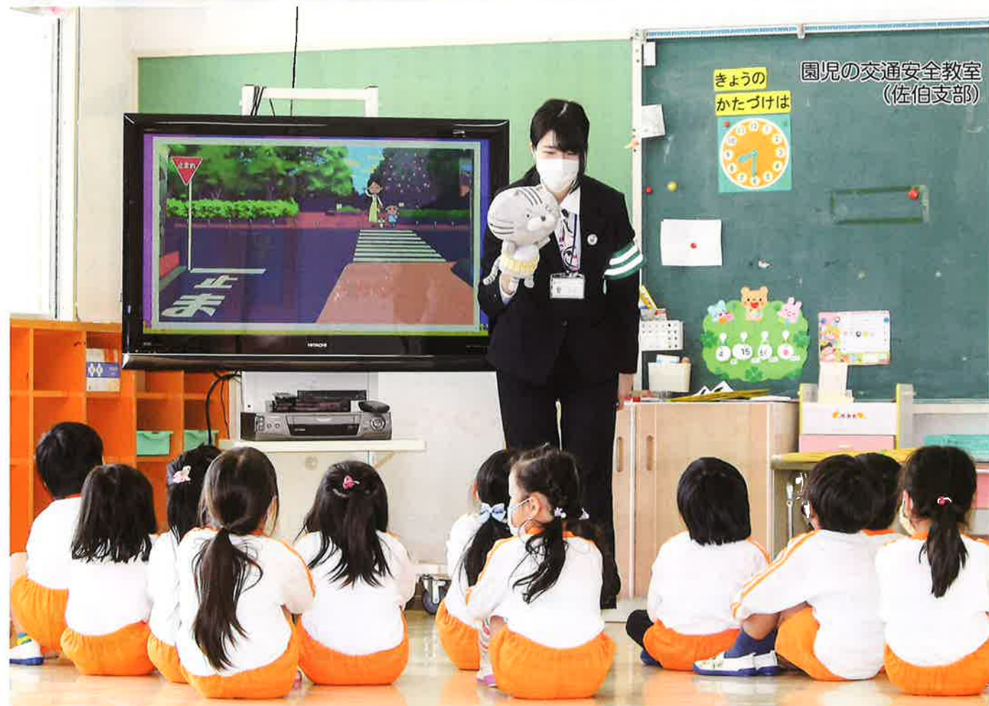
きょうのかたづけは 園児の交通安全教室 (佐伯支部)